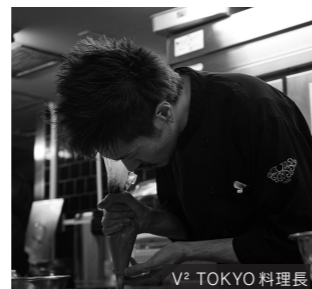
V² TOKYO 料理長

東京キュージン・スタイル 赤坂プリンスホテル、adding;blueなどで研鑽を積み、麻布の外国人会員制クラブではベーカリー、パストリー部門で技術を磨く。その後日本橋マンダリンオリエンタルでTAPAS MOLECULAR BARに勤務し、モダンスペイン料理を学ぶ。2008年渡仏し、4軒の★付レストランにて修行後、Fish Bank Tokyoでスーシェフを務め、V² TOKYO 料理長へ。各国の料理に精通し、製菓製パンの技術を以て料理を供する。